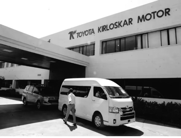
આધારિત હોઈ શકે છે.

ટોયોટા કિર્લોસ્કર મોટર (ટીકેએમ) એ સોમવારે મહારાષ્ટ્રના બિડકીન ઇન્ડિસ્ટ્રિયલ એરિયામાં, જે છત્રપતિ સંભાજી નગર જિલ્લામાં આવેલું છે ત્યાં તેની નવી ઉત્પાદન સુવિધા સ્થાપવાની યોજના જાહેર કરી હતી. સૂચિત ઉત્પાદન મથક ૨૦૨૬ના પ્રથમ અર્ધભાગમાં શરૂ થવાનું છે. ઉદ્યોગના સ્ત્રોતો મુજબ, આવનારી સ્પોર્ટ્સ યુટિલિટી ક્લસ્ટર (એસયુવી) ઘાઉલિન્ડ જેવા બજારોમાં હાલમાં વેચાતી લેન્ડ ક્રુઝર એફજી પર આધારિત હોઈ શકે છે.